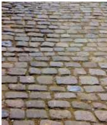
[Abb. 2: Kopfsteinpflaster – Der Albtraum für alle Rollstuhl- und Rollifahrer.]

Nun war am 2. Juni-Wochenende bei uns im Ort wieder einmal die jährliche Kirmes. Am Samstag, war ich mit meiner Frau dort. Die Kirmes ist mitten in der Innenstadt, die während dieser Tage für den KFZ-Verkehr gesperrt ist. Die Hauptgeschäftsstraße ist als Zone-20 ausgewiesen. Um dem KFZ-Verkehr dies teilweise auch aufzuzwingen kam man seinerzeit bei der Planung auf die glorreiche Idee ein größeres Stück der Straße – wie zu DDR-Zeiten – mit Kopfsteinpflaster zu belegen. Dieses Straßenstück ist so polterig und uneben, dass es einem Rollstuhlfahrer kaum möglich ist es zu befahren. Selbst wenn man hier einen Rollstuhl schiebt bereitet dies größte Anstrengung und Mühen. Es ist, schlichtweg gesagt, eine Zumutung für alle Behinderten.