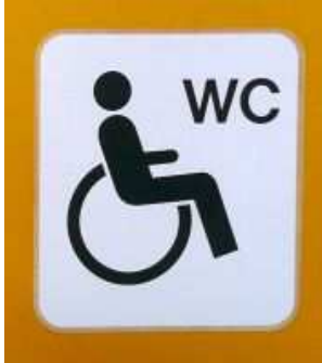
[Abb. 1: So etwas sucht man in vielen Orten vergebens – ein Behinderten-WC.]